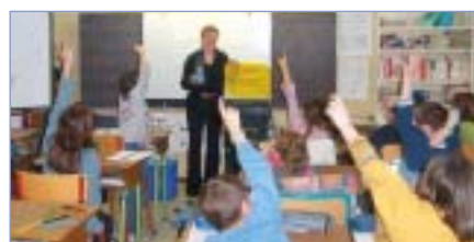
Intervention dans une classe CE2/CM1 à Bouillancy en mars 2004.

A la fin de la séance, ils sont heureux de dire qu'une fois chez eux, ils vont faire la leçon à leurs parents et leur éviter, peut-être, la désagréable surprise de trouver une étiquette "erreur de tri" sur le bac jaune de la maison !