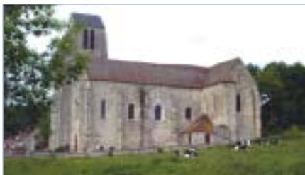
Eglise de Bouillancy

Bouillancy est la commune du RPI qui possède le plus de classes : 4. Son comité des fêtes, commun à Reez, organise chaque année tournois de pétanque, de ping-pong et dîners. Un plateau d'évolution permet de pratiquer basket-ball, tennis, hand-ball et volley-ball. La commune envisage des travaux d'amélioration de ses trottoirs.