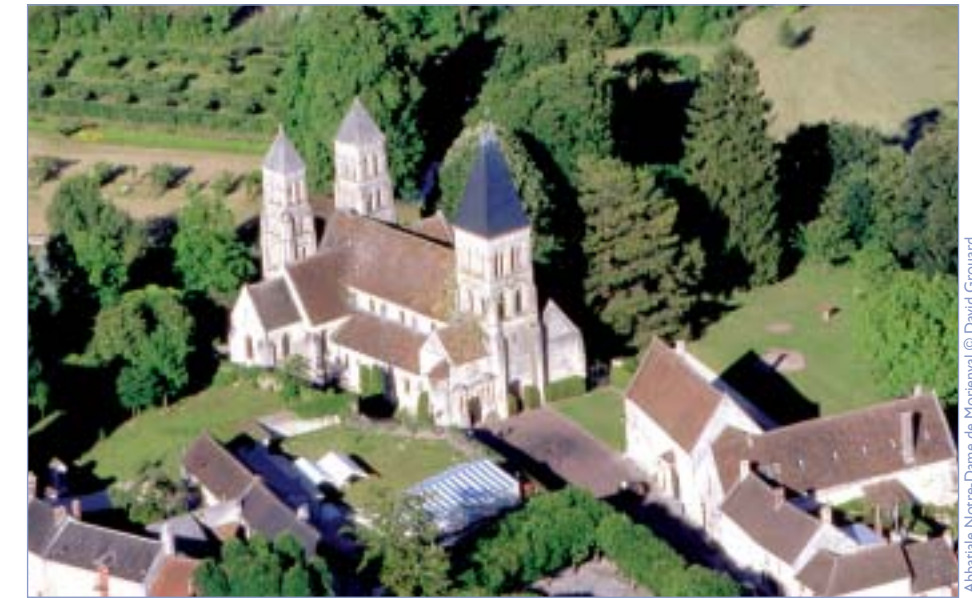
Abbatiale Notre-Dame de Morienvall © David Grouard

Au programme, visites commentées dans les sites les plus prestigieux, expositions relatives au contexte historique, artistique et local dans lequel ont été créés ces vitraux, animations par des maîtres-verriers, conférences, diaporamas, ateliers pour enfants, jeux, concours, rencontres avec les habitants des villages concernés et circuits individuels ou collectifs.