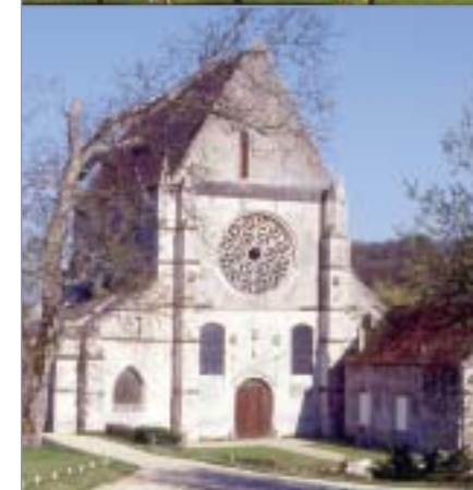
Église Notre-Dame de Piondron © Georges Lermoud