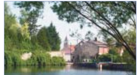
Vue de Villers-Saint-Genest

La commune sera bientôt dotée d'une carte communale qui donnera les lignes directrices de l'urbanisation et de l'amélioration du cadre de vie.