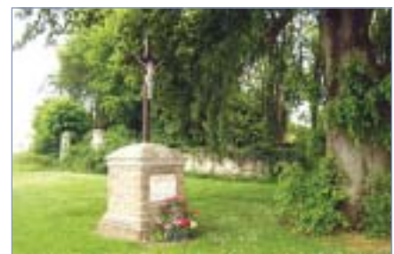
Le calvaire de Reez-Fosse-Martin

gent un comité des fêtes, favorisant des contacts étroits entre la population lors des traditionnels dîners et tournois de pétanque ou ping pong. Cette charmante commune a pour projet immédiat d'améliorer l'éclairage public.