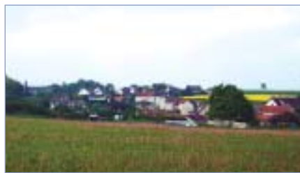
Vue de Brégy

Une station d'épuration sera mise en service courant juin 2004. Le presbytère va être transformé en 3 appartements et le Chantier-Ecole de la CCPV (cf. page 2) va rénové les abords de l'église en septembre.