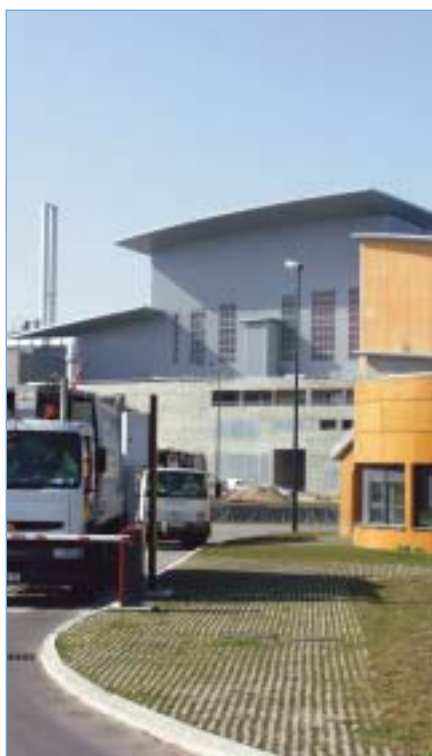
Centre de traitement des déchets VERDI

Inauguré la lundi 8 novembre 2004 par Serge Lepeltier, ministre de l'Écologie, le centre de valorisation énergétique de Villers-Saint-Paul est aujourd'hui une référence nationale dans son domaine.