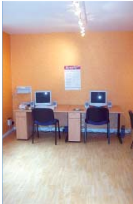
Site du Plessis-Belleville

Que vous ayez bénéficié d'initiation sur les sites Picardie en ligne ou appris par vous-même, vous pouvez passer le PIM. Après un test d'une demi-heure environ, il vous sera remis, en cas de succès, une attestation enregistrée par la CCPV, que vous pourrez présenter au cours de vos différentes démarches, et notamment lors de la recherche d'un emploi.