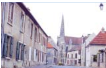
Rue de Baron

Avec l'aide du Conseil régional et du Conseil général, Baron aura sa salle des fêtes pour le 1 er semestre 2006 ; le 2 e semestre de cette même année verra la construction de 21 maisons sur un lotissement de grande qualité.