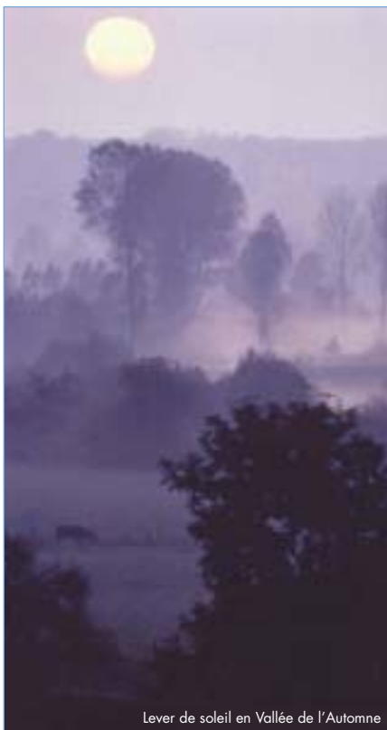
Lever de soleil en Vallée de l'Automne

Le patrimoine architectural de cette région, pourtant théâtre de nombreux conflits guerriers, reste diversifié et bien conservé. Ainsi, la vallée de l'Automne demeure la région picarde qui compte le plus de monuments classés ou inscrits.