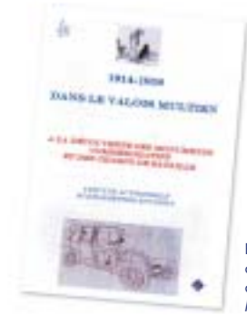
Brochure des élèves du collège Marcel-Pagnol

Cette brochure est à retirer gratuitement à l'Office de Tourisme de Crépy-en-Valois.