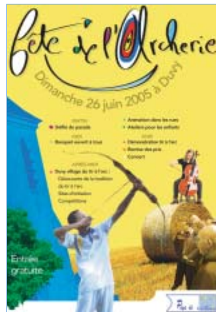
Affiche de l'événement

La CCPV organise un concours doté de plusieurs prix pour la création de l'assiette et de la carte de la Fête des archers du Valois. Les œuvres sont à déposer avant le 15 janvier 2005. Renseignements au 03 44 88 05 09.