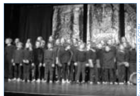
Ensemble départemental