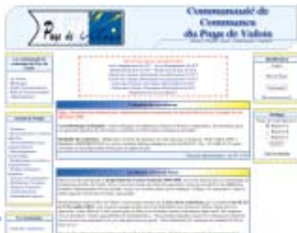
Page d'accueil du site Internet

Il y a 2 ans, la CCPV éditait le premier « Guide des associations du Valois ». Aujourd'hui elle vous donne accès à cette mine d'informations via son site Internet :