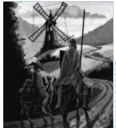
Illustration de Don Quichotte © CCPV