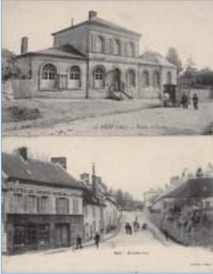
De haut en bas : Betz, Mairie et école [1907] - Betz, Grande rue

Les élèves de 5 e du collège Marcel-Pagnol de Betz redécouvrent les villages de leur canton à travers de vieilles cartes postales de la première moitié du XX e siècle. Anciennes boutiques, signalisations, publicités murales, vie champêtre et cafés d'autrefois nous font revivre le temps