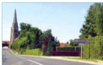
Entrée de Versigny

La vie du village est dynamisée par le comité des fêtes, le bien Allé, fanfare de trompes de chasse, la bibliothèque municipale et Versigny Renouveau. Chaque année, au cours du premier week-end du mois d'octobre, cette association organise le Festival des Plantes, devenu la principale manifestation horticole du Nord de la France. Lui revient également la sauvegarde du château dont le parc est ouvert au public en juillet et en septembre. Outre un centre équestre, Versigny compte des exploitations agricoles et forestières, un menuisier, un maçon, une société de services informatiques et une pension canine. Le schéma d'assainissement autonome est à l'étude et la commune envisage le renforcement des canalisations d'eau potable, la rénovation des routes vicinales et de la maison communale.