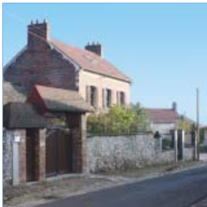
Mairie de Rosières