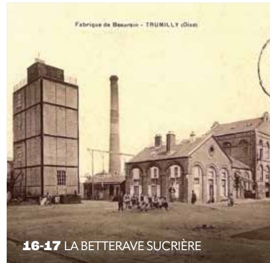
16-17 LA BETTERAVE SUCRIÈRE