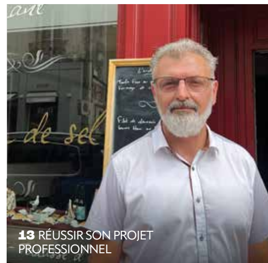
13 RÉUSSIR SON PROJET PROFESSIONNEL