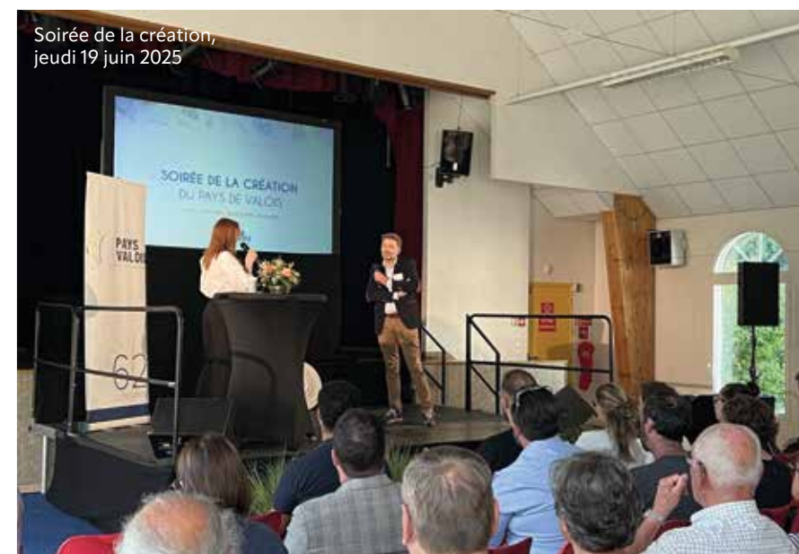
Soirée de la création, jeudi 19 juin 2025

Créer ou reprendre une entreprise est une aventure exaltante mais semée d'étapes décisives. Dans le Pays de Valois, les porteurs de projet ne sont jamais seuls : la communauté de communes et ses partenaires les accompagnent pas à pas pour maximiser leurs chances de succès.