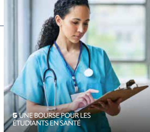
5 UNE BOURSE POUR LES ÉTUDIANTS EN SANTÉ