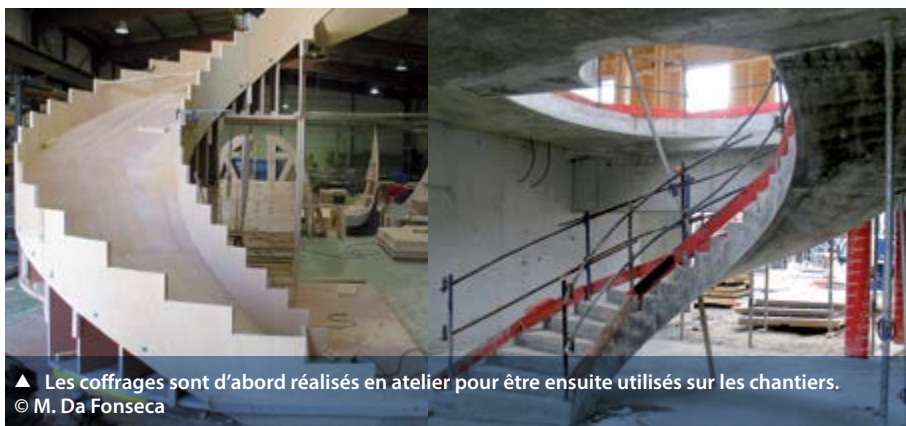
▲ Les coffrages sont d'abord réalisés en atelier pour être ensuite utilisés sur les chantiers.

Manuel Da Fonseca a reçu son trophée le 12 décembre 2013, à l'occasion d'une soirée spéciale organisée par Oise-Est Initiative.