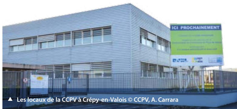
▲ Les locaux de la CCPV à Crépy-en-Valois

En mai 2012, la CCPV achetait pour moitié les anciens bureaux de Case-Poclain à Crépy-en-Valois. L'objectif : y installer le siège administratif de la Communauté de Communes.