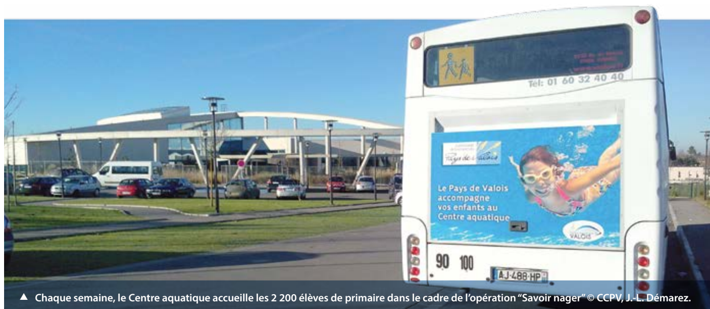
▲ Chaque semaine, le Centre aquatique accueille les 2 200 élèves de primaire dans le cadre de l'opération “Savoir nager”

Fermeture technique du Centre aquatique du Valois du 3 au 9 février 2014. Au programme le grand ménage : vidange des bassins, nettoyage des filtres.