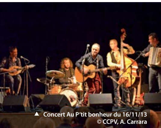
▲ Concert Au P'tit bonheur du 16/11/13