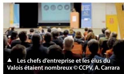
▲ Les chefs d'entreprise et les élus du Valois étaient nombreux

Rendez-vous est pris pour la prochaine édition, le 4 décembre 2014.