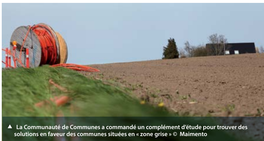
▲ La Communauté de Communes a commandé un complément d'étude pour trouver des solutions en faveur des communes situées en « zone grise »