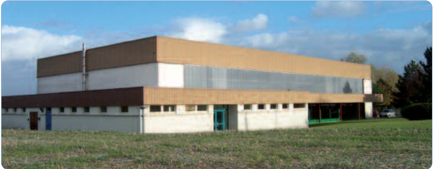
Gymnase Marcel Pagnol à Betz

Dès sa création en 1998, la CCPV est compétente en matière de construction, d'entretien et de gestion d'équipements scolaires. Sont principalement concernés par ces attributions trois gymnases scolaires à Betz, Crépy-en-Valois et Nanteuil-le-Haudouin.