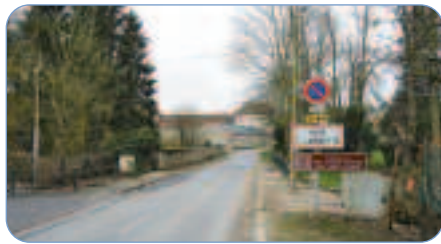
Entrée du village par la RD 84