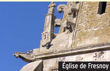
Église de Fresnoy