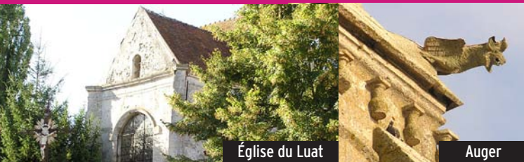
Église du Luat