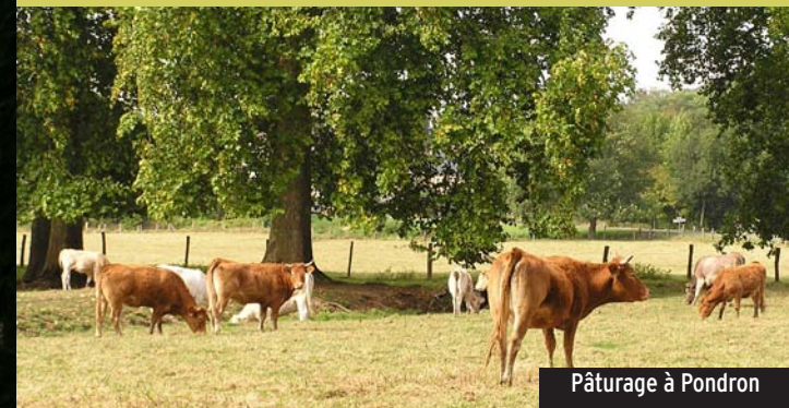
Pâturage à Pondron

De nombreux lavoirs jalonnent le circuit, ainsi qu'un bief (canal qui alimentait la chute d'eau du moulin) visible à Pondron sur la gauche après le carrefour. Les fonds de vallée sont essentiellement utilisés pour la culture du peuplier.