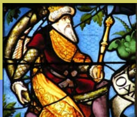
Vitraill à Fresnoy (détail)

célèbre pour ses croisées d'ogives primitives. Visites commentées et animations attendent les visiteurs dans toutes ces églises et chapelles ouvertes pour l'occasion.