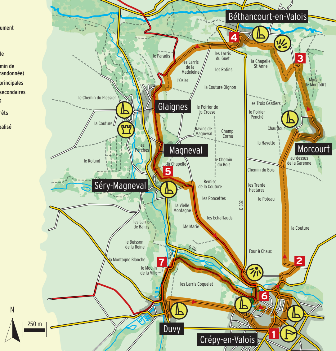
Crépy, La Corandon