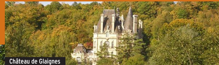
Château de Glaignes

Crépy-en-Valois, l'ancienne capitale du duché de Valois en partie ceinte de remparts, vous ouvre ses belles ruelles pavées bordées de demeures exceptionnelles (du XIV e au XIX e siècle) témoins de son riche passé historique. Le clocher de la collégiale Saint-Thomas Becket de Canterbury fut un lieu stratégique, lors de la guerre de Cent Ans.