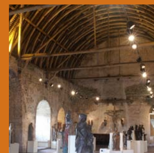
Musée de l'Archerie et du Valois

Après avoir traversé le plateau, on s'enfonce dans le vallon de Morcourt qui rejoint la Vallée de l'Automne, ruban de verdure où s'accrochent des villages aux maisons de pierre extraite des nombreuses carrières locales. Sous le vocable de saint Sulpice, l' église de Béthancourt offre un spectaculaire portail à gâble à six voussures et un élégant clocher en bâtière.