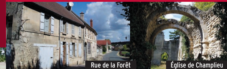
Rue de la Forêt