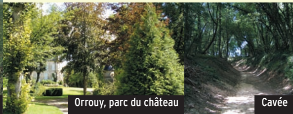
Orrouy, parc du château