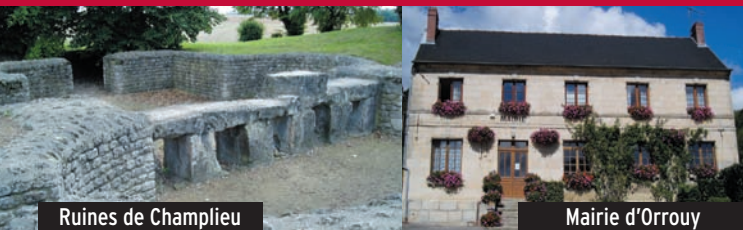
Ruines de Champlieu