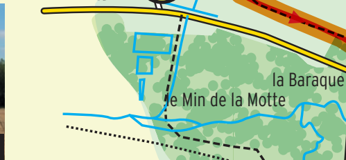
Plateau de Champlieu