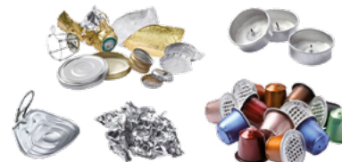
Les petits emballages métalliques