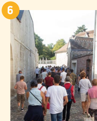
6 PLACE GAMBETTA Visites guidées