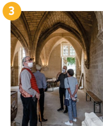
3 ABBAYE SAINT-ARNOUL Visite de l'abbaye