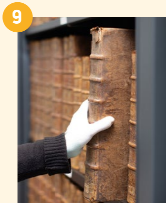
9 LA PASSERELLE