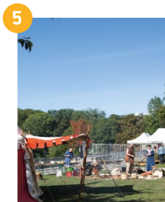
5 MUSÉE DE L'ARCHERIE ET DU VALOIS Campement viking au Musée!